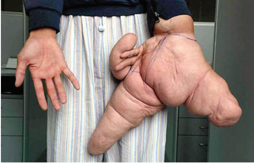
Resim 6: Polyostotic Fibrous Dysplasia