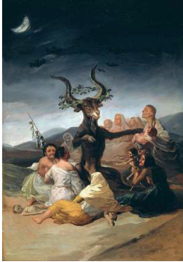
Resim 3. Francisco Goya, Cadıların Şabati , 43x30 cm, 1797-1798.

Uykusu Canavarlar Üretir" (El sueño de la razón produce monstruos) levhası, Romantizmin o meşhur "mantık dışına çıkış" temasının en ikonik dışavurumudur.