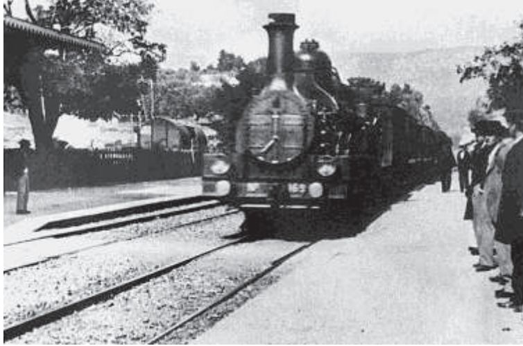
řekil 2. Louis ve Auguste Lumiere, Louis ve Auguste Lumiere'in 1896 Tarihli Kısa Filminden Bir Grnt, 1896.

Lumiere'in "Bir Trenin Gara Giriři" filmi, sinemanın ilklerindedir. Filmde, istasyonda dolařan insanlar ve kameraya doęru gelen bir tren betimlenir. Tren yaklařtıķa izleyicilerin panięi artmıř, izleyenlerin tepki gosterdikleri, masaların altına girerek kendilerini korumak istedikleri grlmřtr. Bylece film sanatı bu noktada doęmuřtur. Bu durum, sadece teknik bir olay deęil, aynı zamanda estetięin yeni bir anlayıřının da bařlangıcını temsil eder (Tarkovski, 1942: 42).