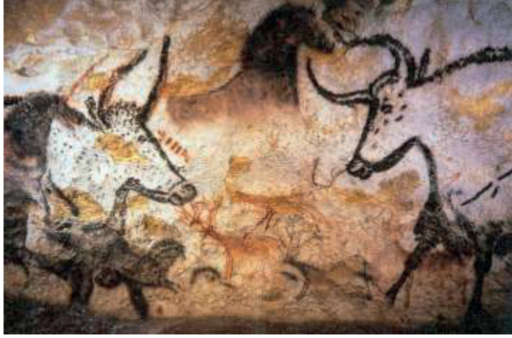
Şekil 1. Yaban Öküzü , At ve Geyik Tasviri, Lascaux