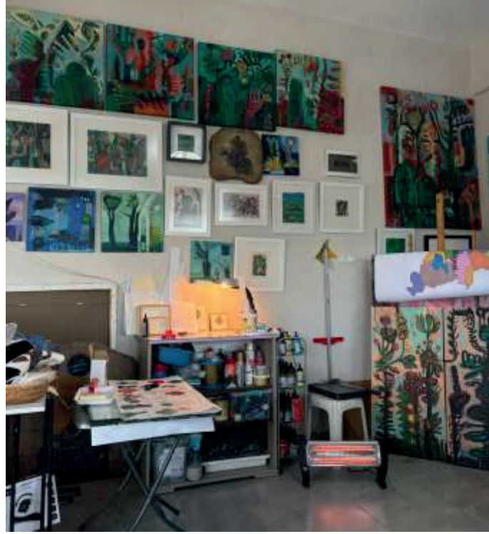
Resim 3. Sanatçının Çanakkale'deki kişisel resim atölyesi