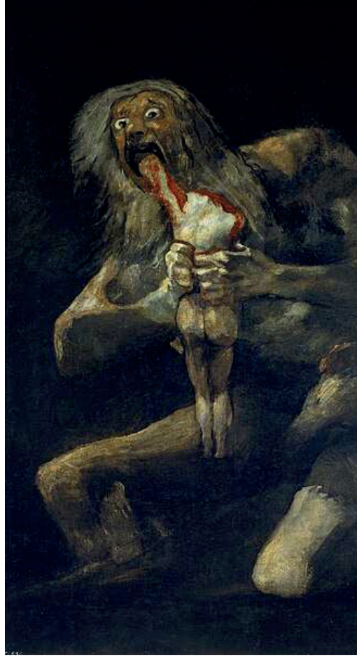
Resim 4. Francisco Goya, Çocuklarını Yiyen Satürn , 146x83 cm, 1819-1823.

Francisco Goya'nın Saturn Devouring His Son adlı eseri, sanatçının en çarpıcı ve en karanlık çalışmalarından biridir. Bu eser, (Resim 4) Goya'nın hayatının son döneminde yaptığı ve sanat tarihinde "Kara Resimler" (Black Paintings) olarak bilinen seri içerisinde yer almaktadır. Sanatçı bu resimleri yaklaşık 1819–1823 yılları arasında, Madrid yakınlarında bulunan evinin duvarlarına doğrudan boyamıştır. Bu dönemde Goya yaşlanmış, ciddi sağlık sorunları yaşamış ve savaşlar ile toplumsal çalkantıların etkisi altında oldukça karamsar bir ruh haline girmiştir. Bu psikolojik ve tarihsel ortam, sanatçının eserlerine yoğun bir karanlık ve dramatik atmosfer olarak yansımıştır.