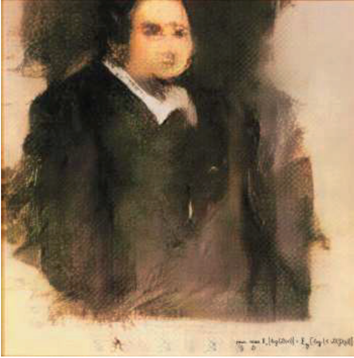
Görsel 4. Obvious, Edmond de Belamy, 2018. ( https://en.wikipedia.org/wiki/Edmond_de_Belamy E.T. 14.02.2026)

düşündüyse, eser ona aittir. Ancak yapay zeka destekli üretimde bu açıklık anında bulanıklaşmaktadır.