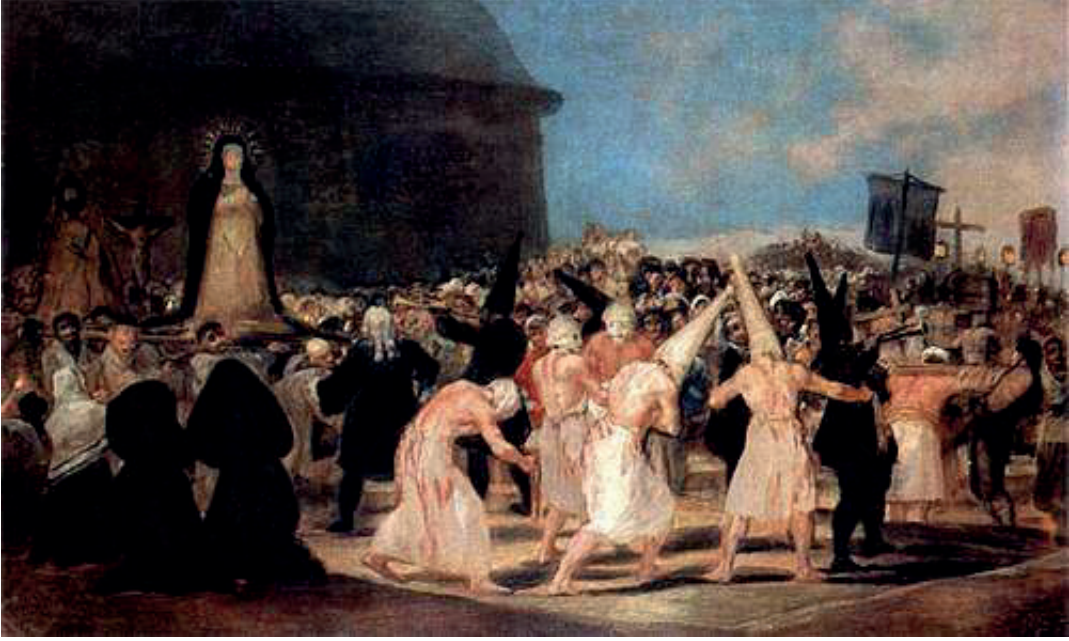
Resim 5. Francisco Goya, Kırbaçlayanların Alayı , 43x73 cm, 1814-1816.

Ayrıca bu eser Goya'nın kişisel psikolojik durumuyla da ilişkilendirilir. Sanatçı bu dönemde ciddi saęlık problemleri yaşamış, büyük ölçüde saęır olmuş ve toplumdan giderek daha fazla uzaklaşmıştır. Bu yalnızlık ve içe kapanma hali onun sanatında karanlık, rahatsız edici ve yoğun duyguların ortaya çıkmasına neden olmuştur. “Çocuklarını Yiyen Satürn” adlı eser de bu ruh halinin en güçlü görsel ifadelerinden biri olarak görülür. Goya burada klasik mitolojiyi yalnızca anlatmakla kalmaz, aynı zamanda insanın korku, güç ve yıkım duygularını son derece çarpıcı bir görsellikle ifade eder.