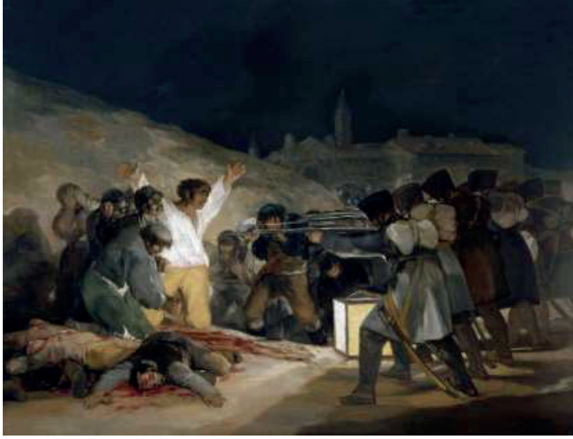
Resim 2. Francisco Goya, 3 Mayıs 1808 , 266x345 cm, 1814.

Goya'nın sanatı, İspanya'nın siyasi çalkantıları ve Napolyon işgaliyle birlikte bir "toplumsal vicdan" mekanizmasına dönüşür. Onun savaş tasvirleri, klasik dönemdeki gibi zaferi kutsayan kahramanlık anlatıları değil; kanın, barutun ve insanın insana uyguladığı vahşetin çıplak birer dökümüdür. Özellikle "3 Mayıs 1808" tablosu (Resim 2), bu trajedinin zirve noktasıdır. Kompozisyonun kalbindeki o beyaz gömleklili figür, sadece bir direnişçi değil; karanlığın ortasında parlayan bir masumiyet ve çaresizlik anıtıdır. Kollarını iki yana açışındaki o dramatik duruş, adeta modern bir çarşıya gerilme sahnesini andırır ve izleyiciye savaşın "yüceliğini" değil, yıkıcılığını haykırır.