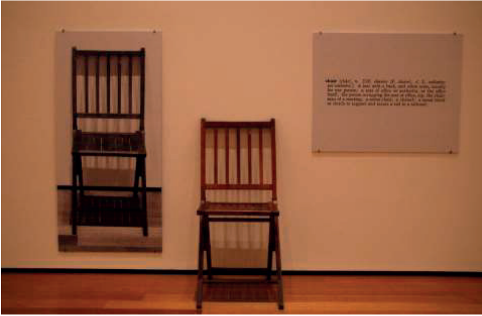
Görsel 2. Joseph Kosuth, One and Three Chairs , 1965.

Joseph Kosuth ve Lawrence Weiner, fikir sanatını farklı ancak birbirini tamamlayan yönlerde geliştirmiştir. Kosuth, sanatı analitik bir önermeye dönüştürmüştür (Kosuth, 1969). 1965 tarihli One and Three Chairs adlı (Görsel 2.) eserinde gerçek bir sandalye, aynı sandalyenin fotoğrafı ve sözlükteki sandalye tanımı bir arada sergilenmiştir.