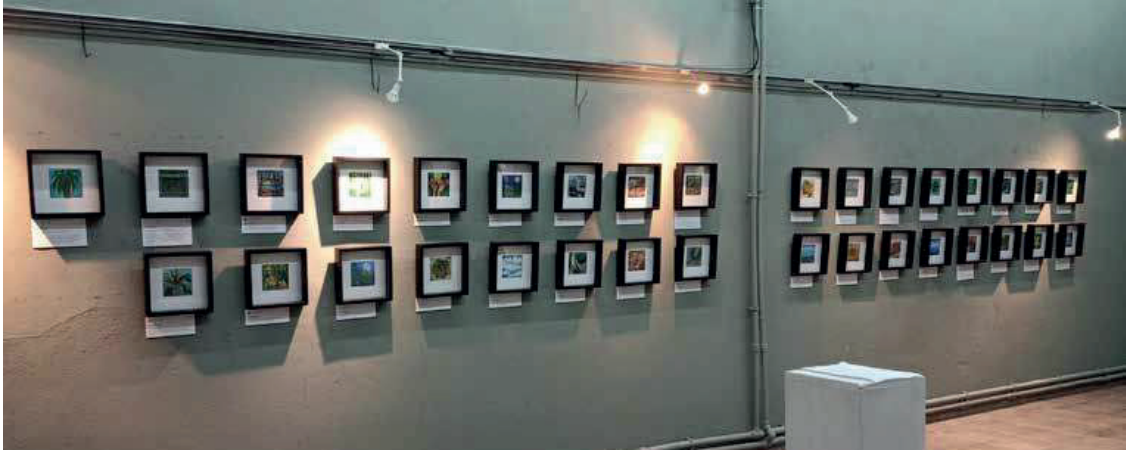
Resim 6. Esenlik Güncesi Sergisi’nden, Mart 2022, Korfman Kütüphanesi Sergi Salonu, Çanakkale

Tedavi sürecinin ardından 2022 yılında tamamlanan radyoterapiyle birlikte Esenlik Güncesi sergisi ortaya çıkar. (Resim 6) Otuz üç günlük tedavi süreci boyunca günlük yürüyüşlerde çekilen görüntüler, kısa metinlerle sosyal medya paylaşımlarına dönüşür; sergi sürecinde ise bu metinler genişletilerek görsel üretimle birlikte bütüncül bir anlatıya kavuşur. Sergi, sanatçının hastalık ve tedavi süreciyle vedalaştığı bir bütün olarak kurgulanır ve bu bağlamda babaya yazılan bir mektup da serginin duygusal omurgasını oluşturur. Ayrıca sergi, Kepez’de kurulan “Kendi Yolunu Fark Et” adlı dayanışma derneği aracılığıyla, kanser tedavisi gören bir çocuğa destek olma amacı taşır; böylece kişisel deneyim toplumsal bir dayanışma alanına açılır.