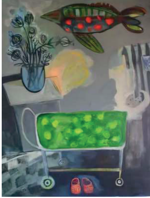
Resim 5. Ezgi Yemenicioğlu, Tuval üzerine akrilik, 60x80 cm, 2008.

Yaşam döngüsünde belirleyici bir başka eşik, sanatçının 2020 yılında babasını kaybetmesiyle deneyimlediği yas sürecidir. Bu kayıp, Ezgi'nin anlatısında “hayatımda çok önemli bir sahnenin sonu” ifadesiyle betimlenerek, yalnızca biyografik bir kırılma anı olarak değil, aynı zamanda varoluşsal ve duygusal bir dönüm noktası olarak konumlandırılmaktadır.