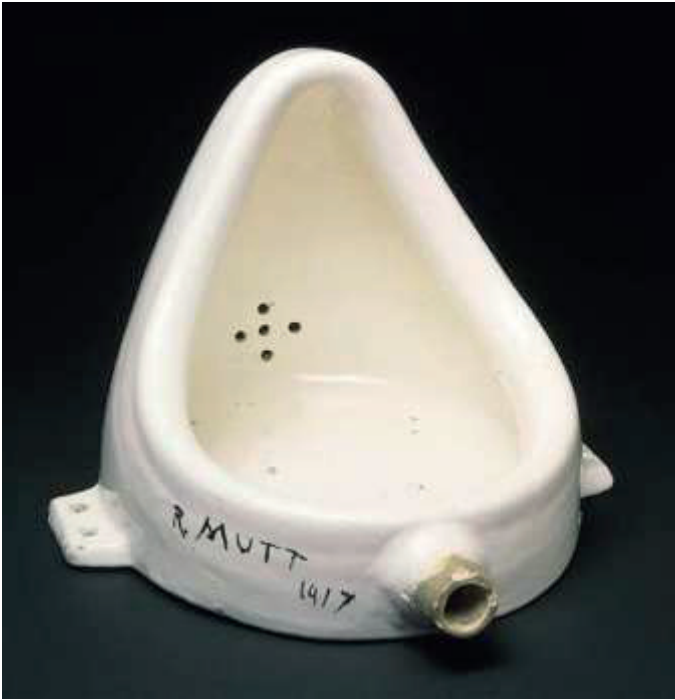
Görsel 1. Marcel Duchamp, Fountain, 1917.