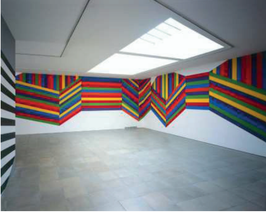
Görsel 3. Sol LeWitt Wall Drawing #1138: Forms composed of bands of color , 2004. ( https://www.lissongallery.com/artists/sol-lewitt/ E.T. 12.02.2026)

Bu talimat, fiziksel uygulamayı yönlendiren ancak kendisi uygulamadan bağımsız olan bir kavramsal çerçevedir. Bir sanatçının şu talimatı yazdığını düşünelim: "Barok ışık-gölge anlayışı (chiaroscuro) ile günümüz kentsel izolasyon duygusunu birleştiren, elinde akıllı telefon tutan bir figürün yağlı boya dokusunda portresi." Bu metin yalnızca teknik bir komut değil, içinde tarihsel bir referans, eleştirel bir kavramsal çerçeve, estetik bir tercih ve bir karşıtlık ilişkisi barındıran dilsel bir yapıdır. Bu boyutlarıyla bir LeWitt talimatıyla yapısal benzerlik taşır; her ikisi de bir düşüncüyü onu hayata geçirecek bir araca ileten dilsel bir köprü işlevi görmektedir.