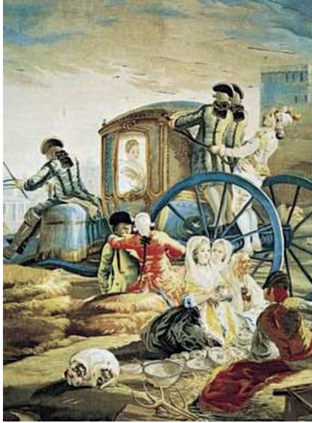
Resim 1. Francisco Goya, Çömlekçi Satıcısı , 375x260 cm, 1794.

ruhunun en karanlık köşelerine uzanan bu süreci şu şekilde yorumlayabiliriz: Francisco Goya, sanat tarihindeki en keskin kimlik değişimlerinden birini temsil eder. Kariyerine sarayın estetik beklentilerine hizmet eden, Rokoko'nun yumuşak ve neşeli dokunuşlarıyla bezeli bir ressam olarak başlasa da, yaşadığı ağır hastalık ve beraberinde gelen mutlak sessizlik (sağırılık), onun fırçasını bir neşter gibi kullanmasına yol açmıştır. Hughes'un da vurguladığı gibi, bu sessizlik Goya'yı dış dünyadan ayırmamıştır; aksine, dışarıdaki gürültünün maskeleydiği grotesk gerçekleri duymasını sağlamıştır.