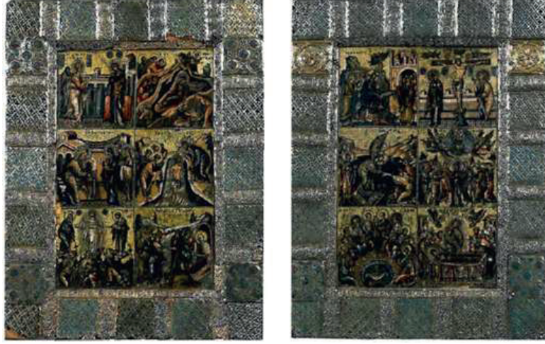
Görsel 3 On iki yortu betimlemeli mozaik diptikon ((Effenberger, 2004: fig. 129)

Bu bağlamda, Sina Azize Katerina Manastırı'nda yer alan 12. yüzyıla ait bir ikona (Kitzinger, 1988: 52) ile Floransa'da, Opera di Santa Maria del Fiore'de yer alan 1300-1350 tarihli mozaik diptikon (Effenberger, 2004: 219-220) On İki Yortu dizgesinin eksiksiz biçimde yer aldığı eserler olarak öne çıkmaktadır (Görsel 3).