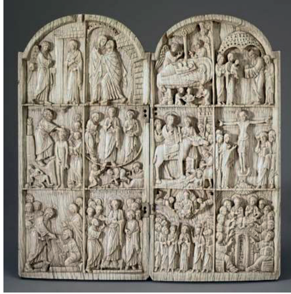
Görsel 2 On iki yortu betimlemeli fildişi diptikon, (Evans, Wixom, 1997: fig. 91)

Elizabet'i Ziyareti ile daha da genişletilmiştir. Şüpheli Thomas ise en alt katmanda Anastasis'in yanında, İsa'nın dirilişine daha çok vurgu yapmak için eklenmiş bir sahne olabilir. Benzer bir durum Sina Azize Katerina Manastırı'ndaki bir 11. yüzyıl ikonasında da görülür. Bu ikona da ise Meryem'in Ölümü yerine, İsa'nın Göğe Yükselişi ve Anastasis'in arasına yerleştirilmiş İsa'nın Kutsal Kadınlara Görünmesi (ya da Herete , Matta: 28: 8-10) sahnesi ile karşılaşıyoruz (Weitzmann, 1971: 293-295).