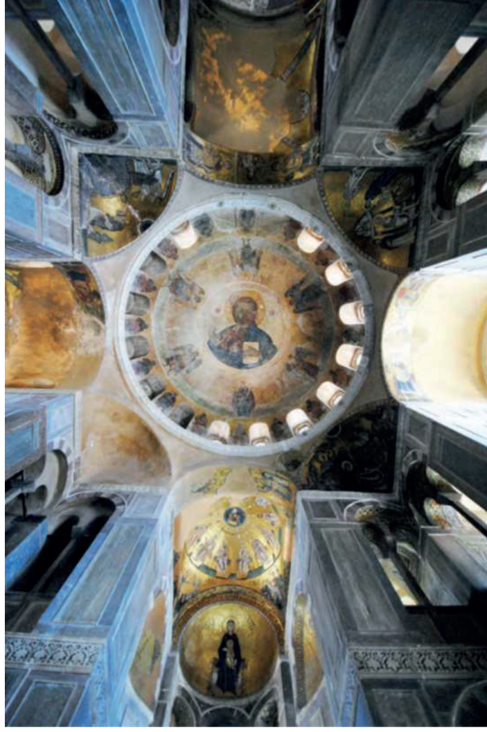
Görsel 4 Hosios Loukas, kathedikon, 11. yüzyıl (Ousterhout, 2019: fig. 17.15)

Bununla birlikte Daphni naos mozaiklerinin ortaya çıkardığı sonuç, dodekaörthon dizgesinin en azından 11. yüzyıl boyunca katı biçimde bağlayıcı bir kural olmadığıdır. Yukarıda da açıklanmaya çalışıldığı gibi dodekaörthon ancak 12. yüzyılda bir kanon halini almış gibi görünmektedir. Kilise takvimi içerisinde belirlenmiş büyük yortular ya da on iki yortu gibi bazı kategoriler sanatçılar için muhtemelen genel başlangıç referanslarını sağlıyordu. Ancak yapının boyutları, bağlamı ve işlevine göre program belli oranda bir esneklik ile uygulanabiliyordu. (Maguire, 1992: 205-206). Bununla birlikte, söz konusu esnekliğin bir sınırının olduğu da açıktır. Örneğin, yortu sahnelerinden oluşan bir dizi içerisinde Meryem'e Müjde, İsa'nın Doğumu, İsa'nın Vaftizi, İsa'nın Çarmıha Gerilmesi ve Anastasis gibi sahneler hemen her örnekte sabit kalır. Özellikle kiliselerde bu sahnelere yapının en görünür noktalarında yer verilir. Dizinin ilk üç sahnesi; Meryem'e Müjde, İsa'nın Doğumu, İsa'nın Vaftizi genelde naosta en belirgin yer olan tromp nişleri üzerine doğudan başlayarak yerleştirilir. Bu tür kurallar