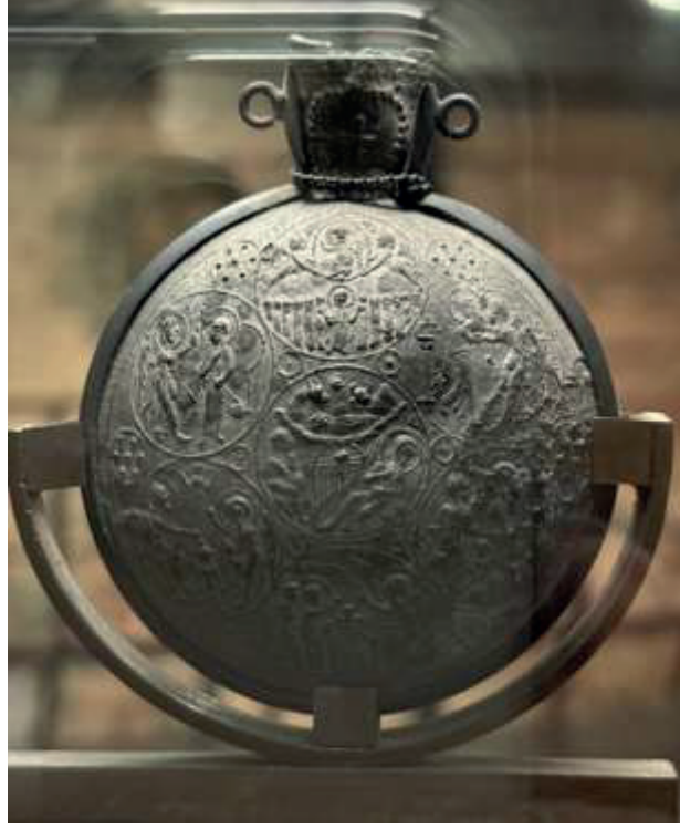
Görsel 1 Monza ampulası, 600 civarı, Monza, Cathedral Museum and Treasury (Caskey, vd. https://artofthemiddleages.com/s/main/item/145 , Şubat 2026)

belki de buydu. Yortu imgelerinin işlevi sadece bir öykü anlatmak değil aynı zamanda (öykünün gerçekleştiği yere ilişkin) uzamsal bir algı yaratmaktı.