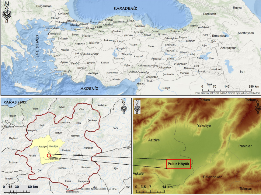
Harita 1. Pulur Höyüğü'nün konumu