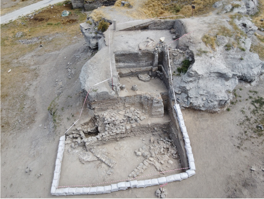
Resim 1. 2021 ve 2022 Yılları Kazı Çalışmalarının Ardından Pulur Höyük