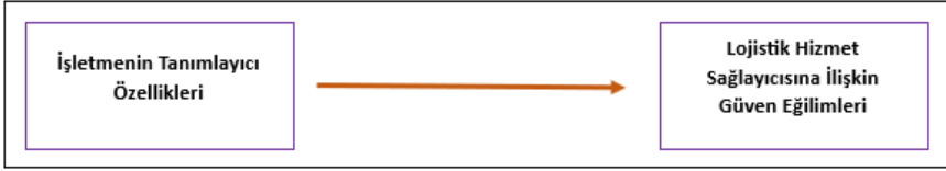
Şekil 1. Araştırmanın Modeli

Araştırmanın modeli ihracat yapan işletmelerin lojistik hizmet sağlayıcılarına yönelik güven eğilimlerinin işletme tanımlayıcı özellikleri itibariyle incelenmesi amacını taşımaktadır. Araştırmada kullanılan model Şekil 1.’de gösterilmiştir.